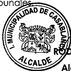
RODRIGO MARTINEZ ROCA Alcalde de Casablanca